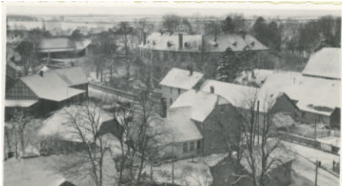
Wendhausen, veröffentlicht am 13. Dezember 2020. Blick vom Kirchturm in das Unterdorf.

LEHRE Winterbilder für digitalen Adventskalender gesucht