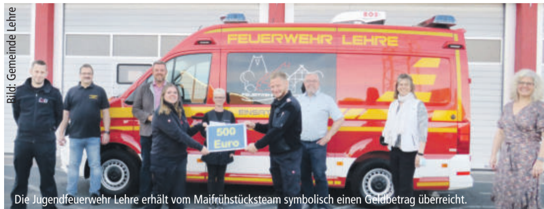
Die Jugendfeuerwehr Lehre erhält vom Maifrühstücksteam symbolisch einen Geldbetrag überreicht.