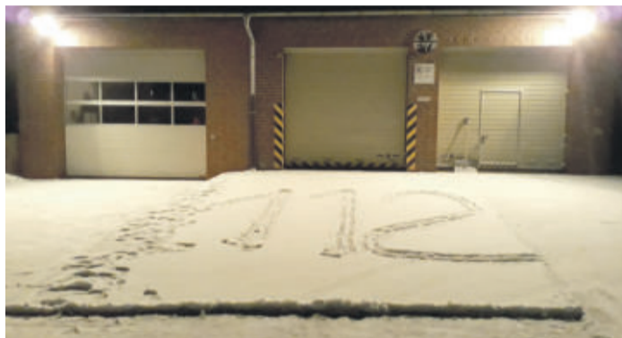
Beienrode, veröffentlicht am 1. Dezember 2019. Das Foto von Heiko Rosilius entstand im 2018 und zeigt die Notrufnummer der Feuerwehr im Schnee vor dem Feuerwehrgerätehaus Beienrode.

Wie in den vergangenen Jahren möchte der Kulturverein Lehre wieder den Digitalen Adventskalender für die Gemeinde Lehre anbieten. Dafür werden aus jeder der acht Ortschaften jeweils drei winterliche Bilder benötigt.