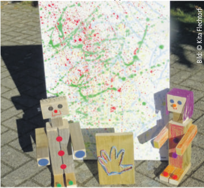
Künstler „Der Roten Gruppe“ aus der Kita Flechthorff stellen Ihre Werke vor

Im Rahmen eines Kunst- und Kreativprojektes haben die Kinder der Rote Gruppe aus der Kita Flechthorff verschiedene Mal- und Farbtechniken ausprobiert und Holzarbeiten erarbeiten können. „Die Kinder waren begeistert mit Farbe zu experimentieren und mit Hammer und Nägel arbeiten zu dürfen“ so das Erzieherinnen-Team der roten Gruppe um Henrike Aukam-Sici-