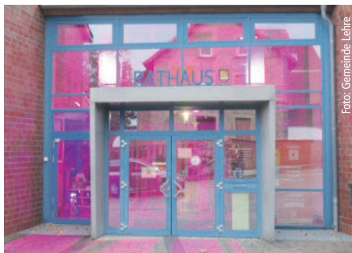
Das Rathaus erstrahlte jetzt anlässlich des Welt-Mädchentags in Pink.