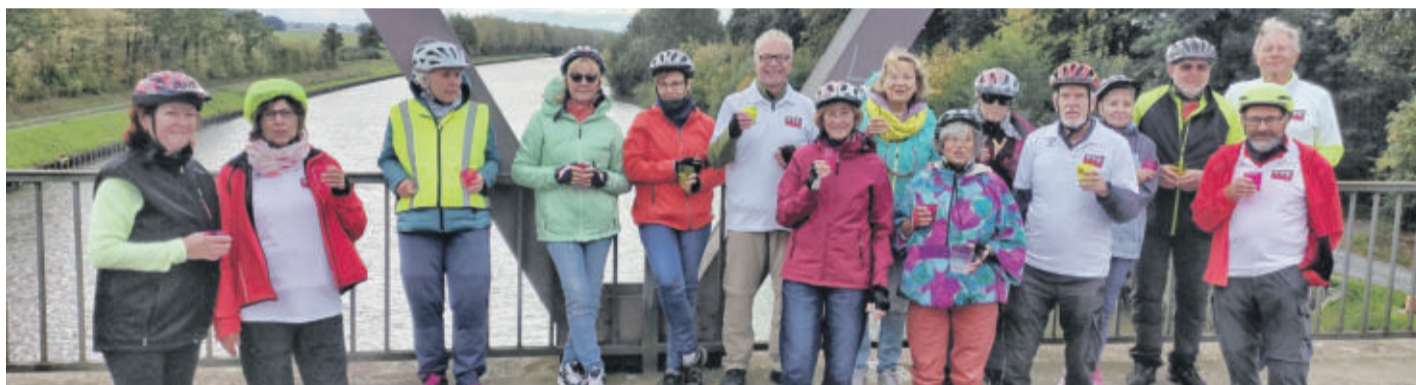
Trinkpause auf der Brücke über den Mittellandkanal nahe Martinsbüttel.

FLECHTORF TTC Radsportgruppe traf sich zur letzten Tour des Jahres