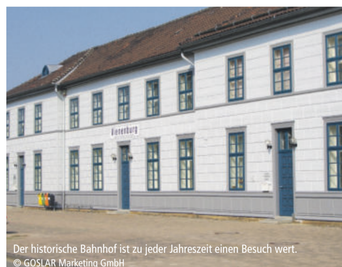
Der historische Bahnhof ist zu jeder Jahreszeit einen Besuch wert.

Weitere Informationen Goslar Marketing GmbH Markt 7, 38640 Goslar Telefon: 05321 780660 Mail-Adresse: marketing@goslar.de