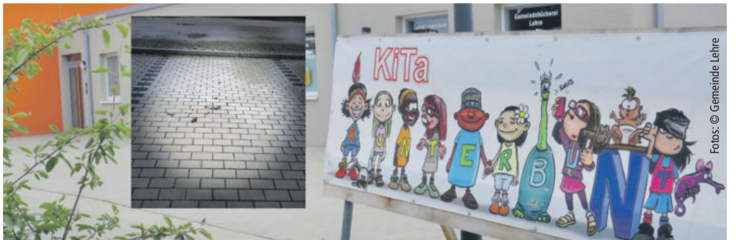
An der Kita in Lehre kam es zu Sachbeschädigungen.

LEHRE Zerstörungen in der Kita Kunterbunt