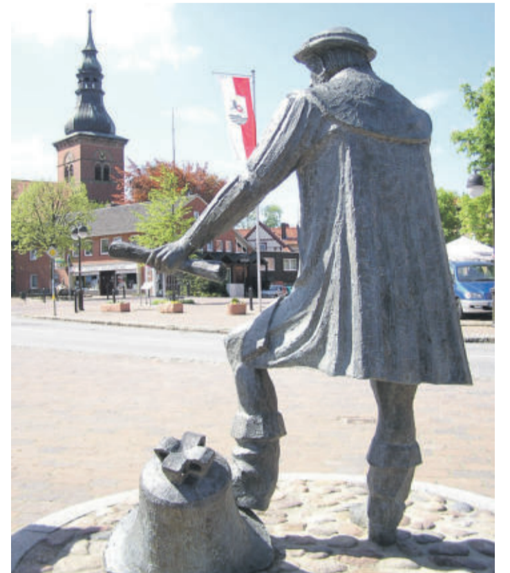
Ortsmitte mit St.-Petri-Kirche