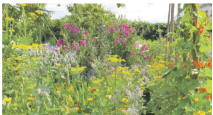
Bienenfreundliche Pflanzen im Garten sind nicht nur Insektennahrung, sondern auch in der Küche vielseitig einsetzbar.

Zur Einnahme der Präparate meint Beutling: „Ich empfehle, diese rechtzeitig einzunehmen, bevor es ganz schlimm wird – und dann auch durchgehend dabeizubleiben, bis die jeweiligen Allergene abflauen.“ Zudem sollte man Pollen täglich mit einer Nasendusche ausspülen. Lässt man den Heuschnupfen unbehandelt, kann sich ein Etagenwechsel anbahnen, der mit einer Verengung der Bronchien und Asthma einhergeht. Spätestens dann sollte man den Arzt oder die Ärztin aufsuchen, die Kortison oder gegebenenfalls eine Desensibilisierung verordnen können.