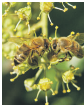
Efeu ist ein echtes Insektenparadies und mit seiner späten Blütezeit eine der wenigen Nahrungsquellen für Bienen im Herbst.