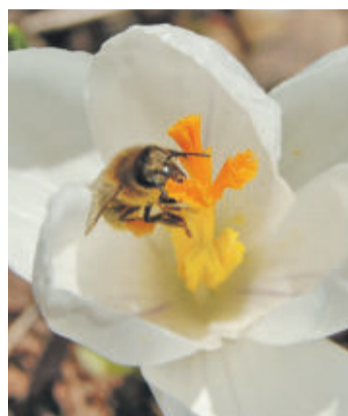
Im Frühling sind die hübschen Krokusse eine der ersten blühenden Anflugstellen.

Besuchen Sie doch einfach Ihre örtliche Imkerei. Dort gibt es nicht nur guten regionalen Honig, sondern auch das gebündelte Fachwissen in Sachen Bienen- und Pflanzenkunde.