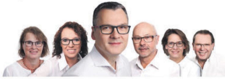
Das kompetente Team von Augenoptik Bock.

Bei einer Sehbehinderung oder Sehbeeinträchtigung spricht man immer häufiger von "Low Vision", was "geringeres Sehen" bedeutet. Low Vision tritt ein, wenn die Sehleistung kleiner als 30 Prozent ist. Dabei kommt eine Sehbeeinträchtigung nicht nur bei älteren Menschen vor. Die Ausprägungen einer Sehbehinderung können einen unterschiedlichen Charakter aufweisen, deswegen ist die Vielfältigkeit des Angebots an Hilfsmitteln besonders wichtig. Wenn die normale Brille nicht mehr ausreichend ist und Lesen, Schreiben, Arbeiten am PC sowie Fernsehen nicht mehr optimal sind, können hochwirksame Sehhilfen, die Vergrößern und eine bessere Ausleuchtung schaffen, gegen die Beeinträchtigung im Alltag hilfreich sein.