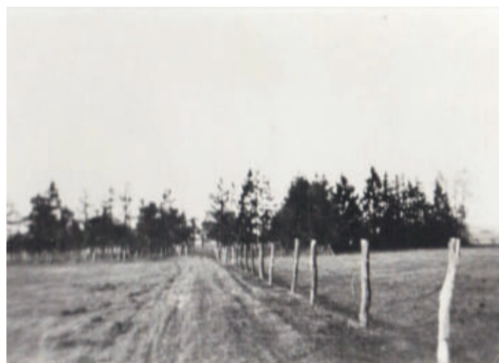
Der Ballwall, ca. 1960er Jahre.