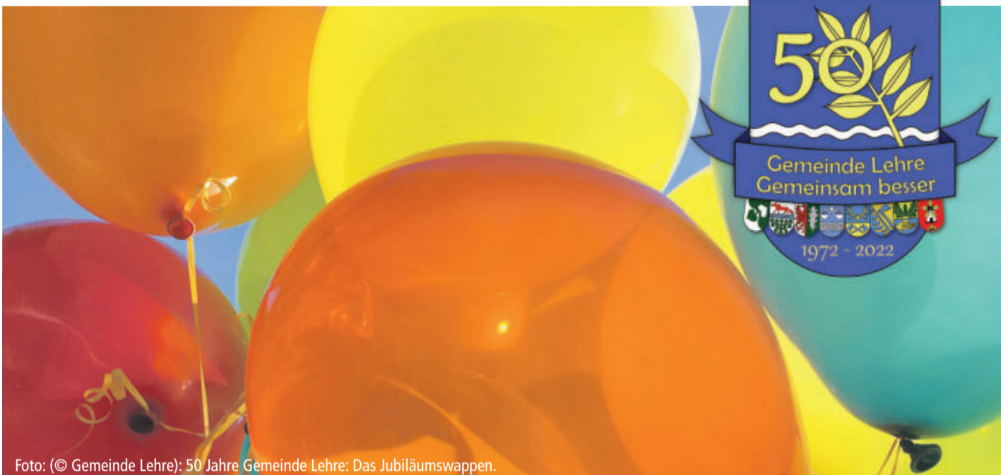
50 Jahre Gemeinde Lehre: Das Jubiläumswappen.