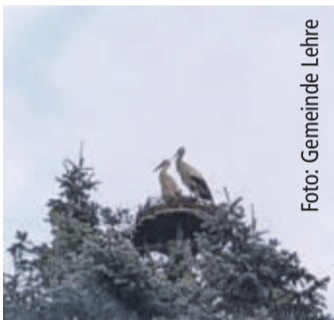
Lehre hat seine Störche wieder.