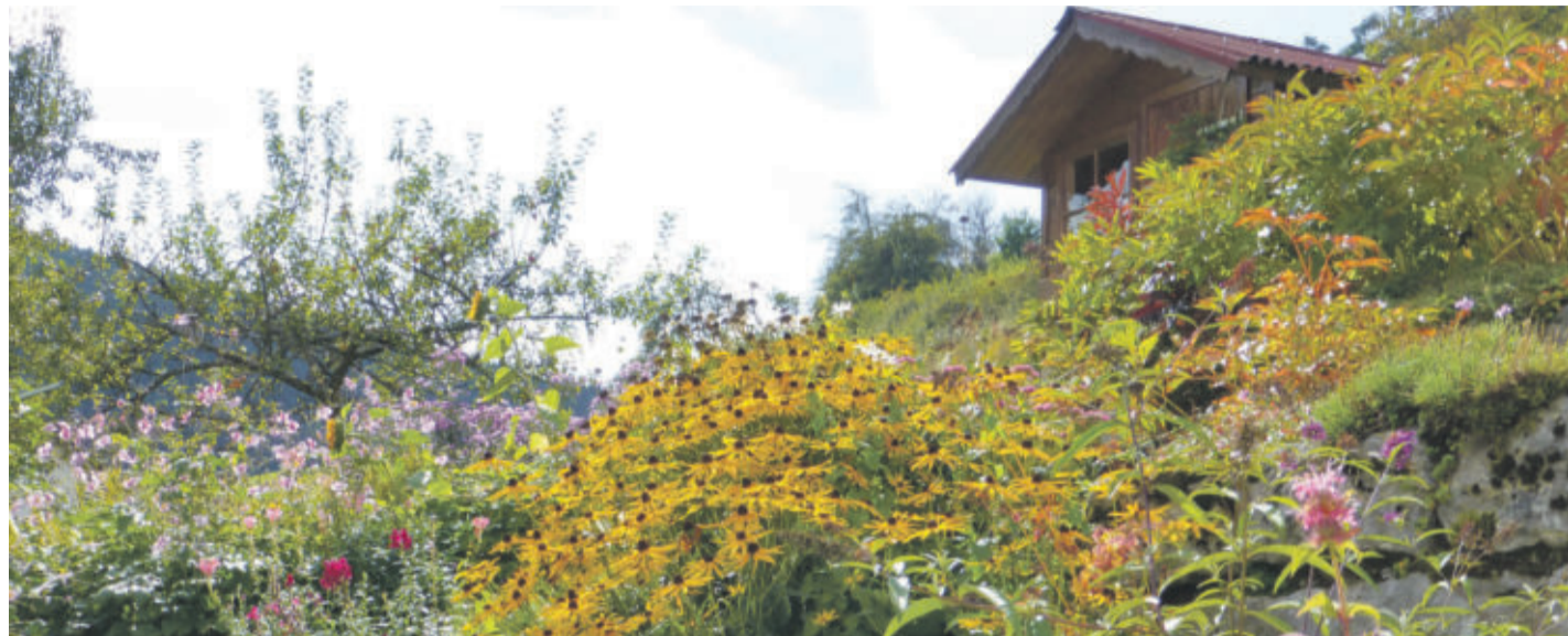
Blühende Stauden und Obstbäume im Garten bieten Honig- und Wildbienen reichlich Nahrung.

GARTEN/BALKON Einen gedeckten Tisch für die fleißigen Insekten machen