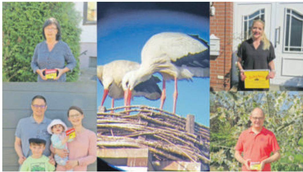
Namensgebung Storchenpaar Flechtorf.

FLECHTORF Namensfindung für das Storchenpaar konnte erfolgreich abgeschlossen werden