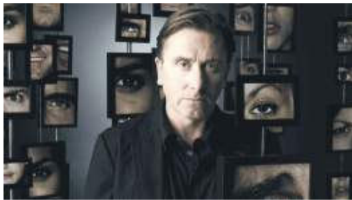
Dr. Cal Lightman