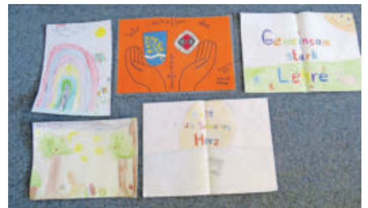
Kinder malen Bilder für den Ratssaal der Gemeinde Lehre.

Kurz vor Ostern rief Bürgermeister Andreas Busch die Kinder aus der Gemeinde Lehre in einer Videobotschaft dazu auf, ihren künstlerischen Ideen freien Lauf zu lassen und bunte Bilder für die Glasfront im Ratssaal zu malen. „Egal ob ein Regenbogen, ein Dankeschön oder die Anti-Corona-Familie – der Kreativität werden keine Grenzen gesetzt“, betont Busch. Durch die Idee werden zum einem die Kinder zu Hause beschäftigt, zum anderen sollen die Bilder vorbei laufenden Menschen ein Lächeln ins Gesicht zaubern.