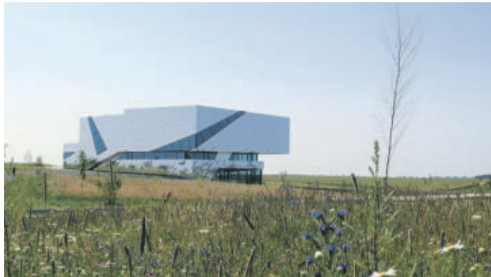
Forschungsmuseum Schöningen „paläon“

REGION Die letzte Etappe auf dem Elmkreis