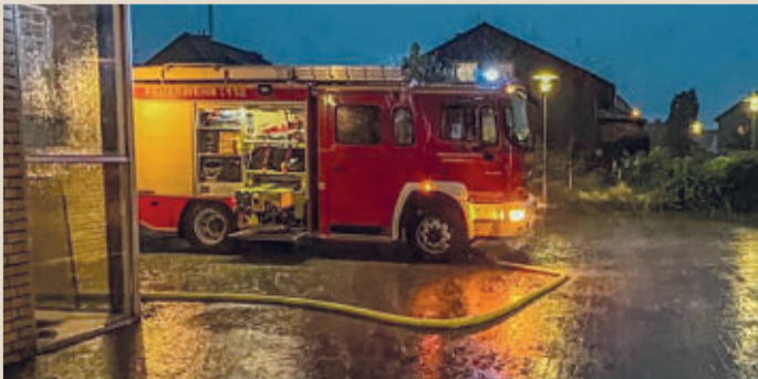
Die Feuerwehr im Unwetter-Einsatz.

LEHRE Starkregen hat die Gemeinde voll erwischt