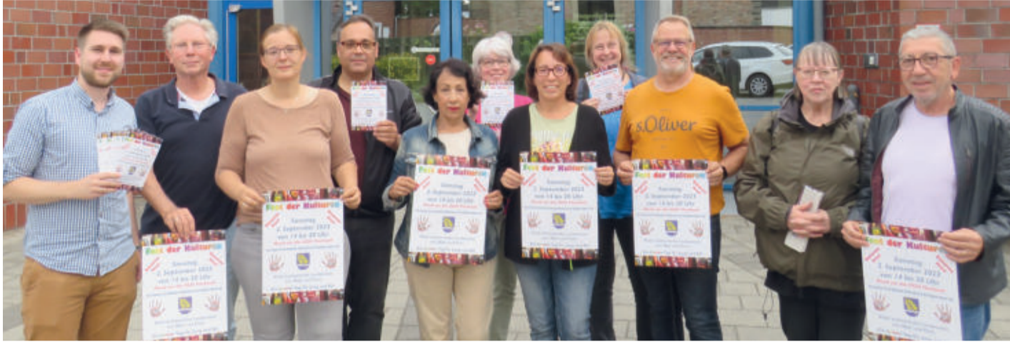
Das Organisationsteam freut sich auf zahlreiche Gäste.