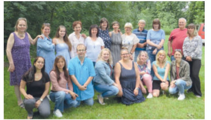
Das Team der offenen Ganztagschule traf sich zum Teamtag.

LEHRE Erfolgreicher Team-Tag an der Börnekenhalle