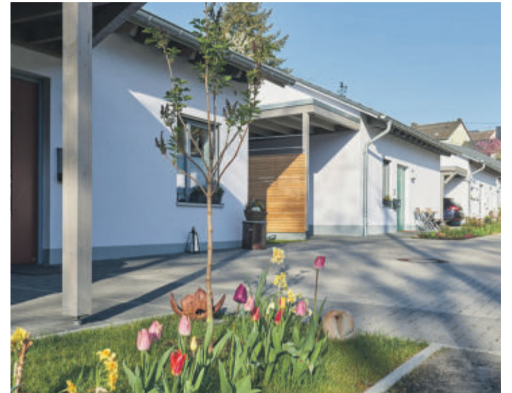
Staatlich gefördert: Für besonders energieeffiziente Neubauten gibt es jetzt wieder finanzielle Zuschüsse.

IMMOBILIEN Staatlichen Zuschüsse sichern