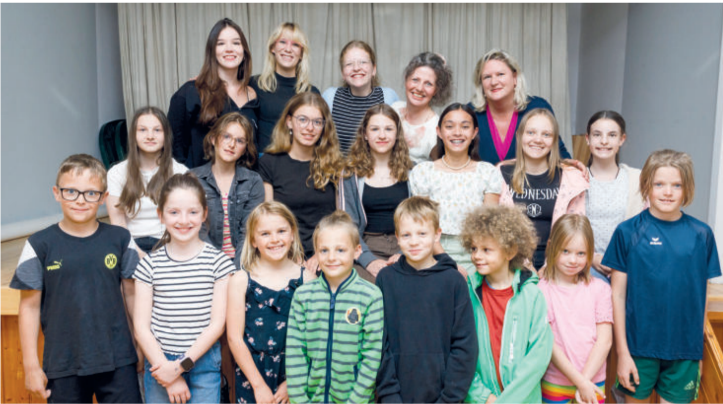
Die Besetzung für das Wintermärchen der Schunterbühne steht jetzt fest.

LEHRE Schunterbühne spielt „Der kleine Gambin“