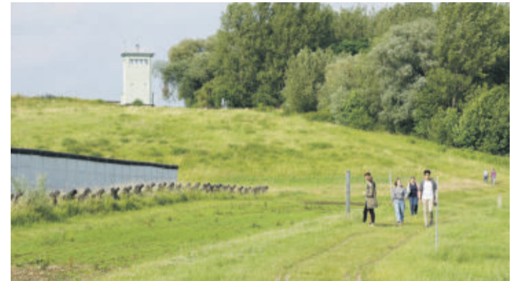
Original erhaltene Grenzanlagen in Hötensleben